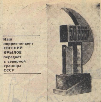
Наш корреспондент ЕВГЕНИЙ КРЫЛОВ передаёт с северной границы СССР